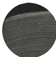
Gesso Acrilico Trasparente