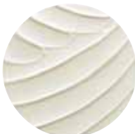
Gesso Acrilico Molto denso